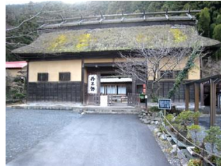
丹三郎屋敷長屋門 (奥多摩町)