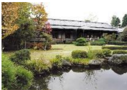
柴又帝釈天題経寺大客殿 (2011年助成)