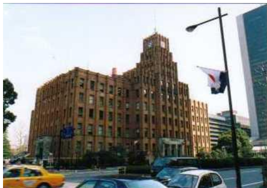
👉 市政会館・ 日比谷公会堂 (千代田区) 2011 年助成

募金は、別紙の「ゆうちょ銀行 振込取扱票」に必要事項をご記入の上、お近くの郵便局でお払込みください。その際、取扱手数料は発生しません。