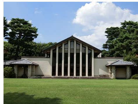
👉 自由学園 女子部食堂 (東久留米市) 2019 年助成