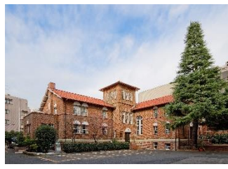
早稲田奉仕園スコットホール (新宿区)