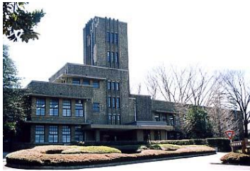
浴風会本館 (杉並区)