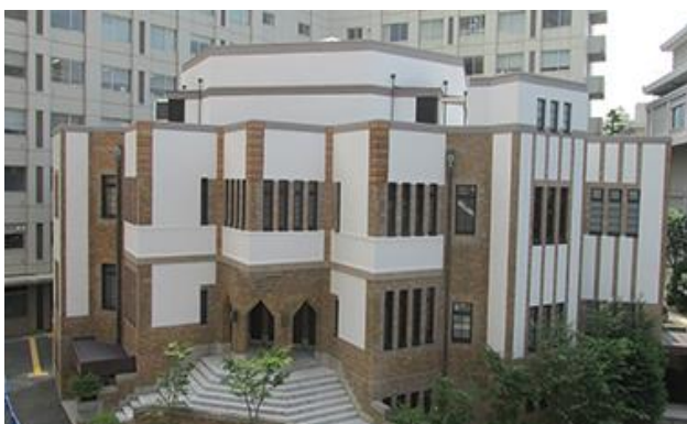
👉 駒澤大学耕雲館(世田谷区)2018 年助成