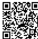
セーフティネット住宅